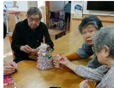
クリスマスの飾り付け

施設内に飾るクリスマスツリーを皆さんで製作してみました。小さいものですが、どこに置いても目立つようにたくさんキラキラの装飾をしてもらいました。完成したツリーはしばらくテーブルに飾ってありました。