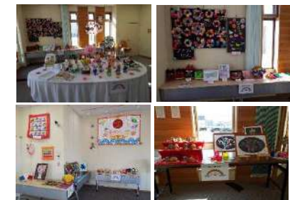
平成31年度まこと作品展

日 時 令和2年2月13日(木)～26日(水) 午前9時～午後3時 (※土曜・日曜を除く) 会 場 大地みらい信用金庫 釧路東支店 (釧路町桂5丁目1番4)