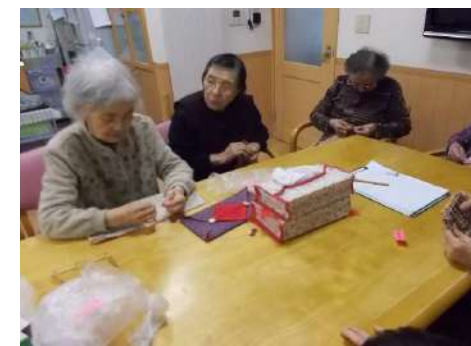
まこと作品展に向けて①

今月のまこと作品展に向けて、ボランティアさん指導の下、ティッシュカバーを製作しています。完成品はぜひ作品展でご覧ください。