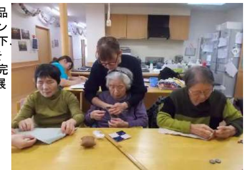
まこと作品展に向けて②

長年の針仕事の経験を生かし、少しだけスタッフに手伝ってもらいながら縫い上げています。完成が楽しみです。