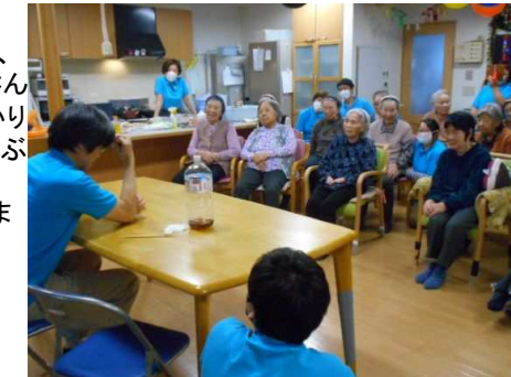
クリスマス会&忘年会④

午後からは職員の出し物。恒例の二人羽織・マジック・バルーンアートを行いました。マジックでコインが消えると「どうして消えたの？」「すごいわ」と驚かれています。