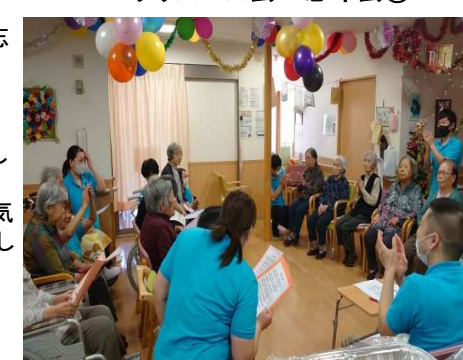
クリスマス会&忘年会②

午前中は各階対抗の歌合戦を行いました。練習の成果を発揮し、審査員の点数制で勝敗が決まりました。軍配は1階の皆さんに上がりました。