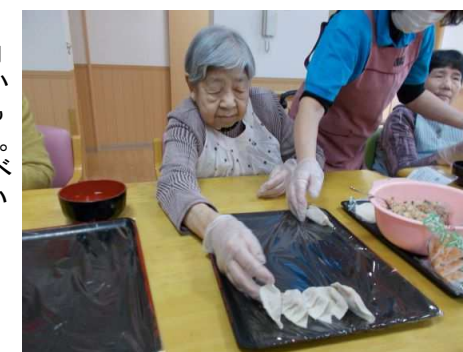
誕生日のお祝い料理をみんなで調理

餃子を作りました。あんを皮で包み、一つ一つ丁寧に包んでいました。「自分たちで作ったから、なお美味しく感じるわ」とあつという間にペロリと召し上がっていました。