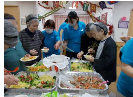
クリスマス会&忘年会③

屋食はケンタッキーやちらし寿司、エビチリなど、皆さんの好きな料理ばかり「ケンタッキー久しぶりに食べて美味しい」と喜ばれておりました。