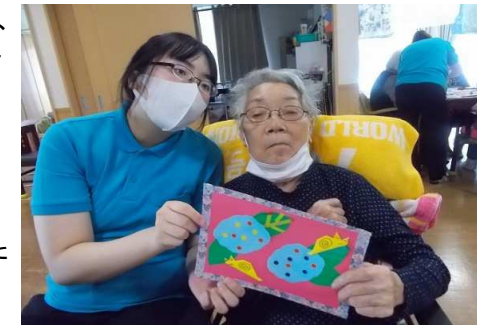
工作レク(あじさい)

色画用紙で紫陽花の形どりをし、貼り絵にして見ました。「綺麗に出来たでしょ。」と笑顔！お家に帰ったら、飾って出来栄を楽しみたいと教えて下さいました。