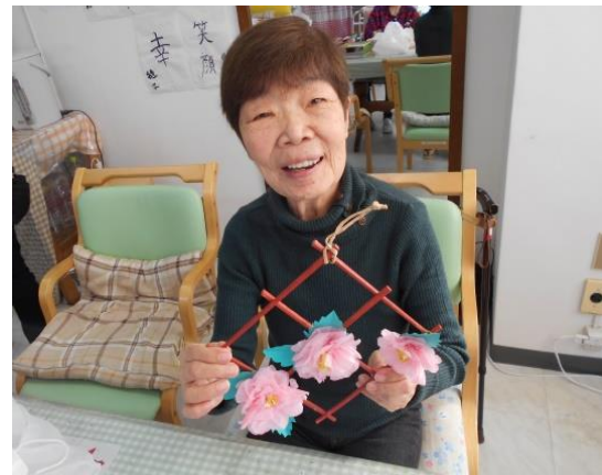
クリスマスのカチューシャ

サザンカのお花はお花紙で作り、枠は割り箸に色を塗って作りました！とても素敵に出来上がり～！ぜひお部屋に飾ってみてくださいね～。