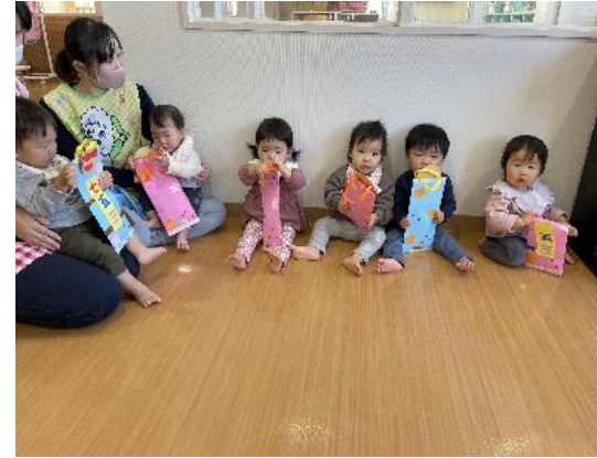
すずらん組(七五三)