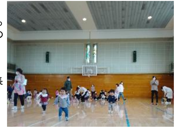
親子レクリエーション