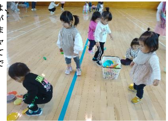
親子レクリエーション