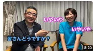
介護の魅力チャンネル第2弾～笑顔の大事さ～