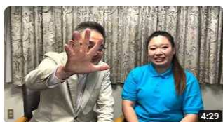
介護の魅力ちゃんねる第五弾～中国人実習生編～