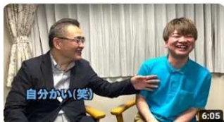
介護の魅力ちゃんねる第一弾～介護の魅力を伝えます～

株式会社リハビリサポートまこと・NPO法人日本医療福祉介護協会は、一昨年からYouTubeに「介護の魅力チャンネル」を開設し、はじめの7回は介護職員(技能実習生)にインタビューをする形で「介護に就いた動機、仕事の内容、ご利用者様の介護や施設での生活の様子、これからの抱負等を聞き介護士としてのやりがいと魅力を発信しています。お蔭さまで最高370回を超えるアクセスといいね👍評価を頂いております。