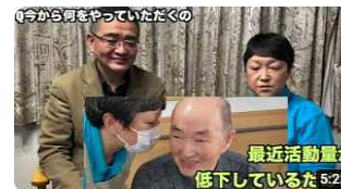
介護の魅力ちゃんねる第七弾～夢～

今年度は、職員とご利用者様・ご家族様のご理解とご協力を頂き、短い時間ではありますが各施設の介護やご利用者様の生活の様子をご紹介します。グループホームやよいの1日の紹介では現時点で856回のアクセスを頂いています。