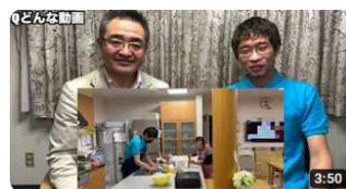
介護の魅力ちゃんねる第六弾～中国人実習生②編～