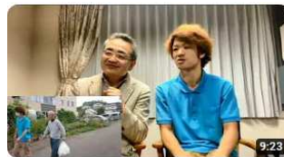
介護の魅力ちゃんねる第3弾～帰宅願望のある方への取り組み～