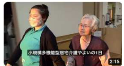
【小規模やよい】1日紹介

興味関心が頂けるなら、是非チャンネル登録して、各施設の介護や生活の様子をご覧いただき、感想や忌憚のないご意見を賜りたいと思います。皆様からいただいた感想やご意見を真摯に受け止め、ご利用者様に最高のサービスを提供できるように邁進して参りたいと思います。今後とも変わらぬご理解とご協力の程よろしくお願い申し上げます。