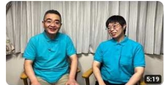
介護の魅力ちゃんねる第四弾～骨折からの復活～